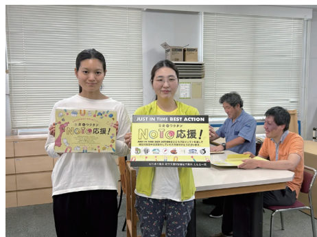
就労支援B型福祉作業所「えもる」

https://prtimes.jp/main/html/rd/p/000000022.000058034.html